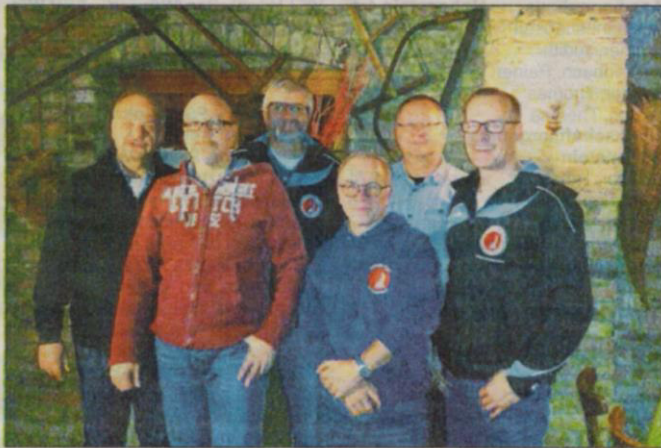
Der frischgewählte Vorstand des Karate Dojo Rüdesheim.

Selbstverständlich wird weiterhin zweimal wöchentlich trainiert und bei Interesse kann man sich informieren unter www.karate-dojo-ruedesheim.de (Erwachsene) oder www.karate-kids-ruedesheim.de (Kinder und Teens).