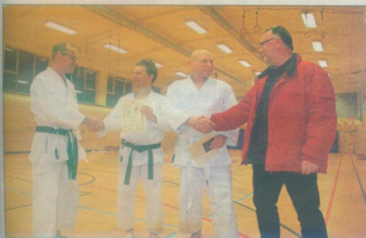
Gratulation nach bestandener Gürtelprüfung.

Bei den Bewegungsausführungen achtete Frickhofen auch auf diesem Lehrgang auf die korrekte Ausführung