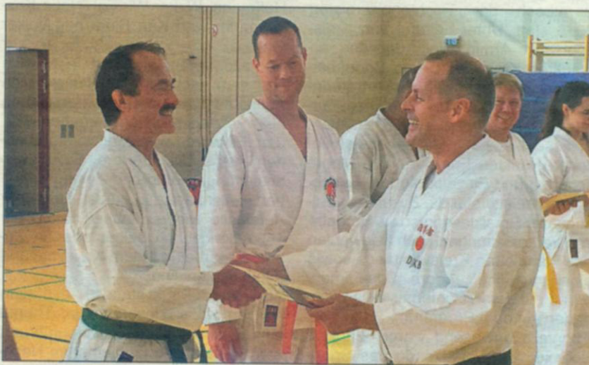
Karate für Jedermann von 4 – 66 Jahren.

Das Training begann bereits um 10 Uhr mit der Kindergruppe (7–11-Jahre), startete dann in den Mittag mit den Jugendlichen und Erwachsenen und endete um 19 Uhr mit den Prüfungen. Somit war auch der Altersanteil von 7 bis 66 Jahren an diesem Tag ein deutlicher Hinweis auf die Vielseitigkeit des Trainings und die gesundheitsfördernden Möglichkeiten, die diese Sportart bietet. Ab September bieten die Rüdesheimer Karateka zudem Training für Kinder von 4–6 Jahren (Karate-Kids-„Minis“) an. Weitere Informationen gibt es unter www.karate-dojo-ruedesheim.de .