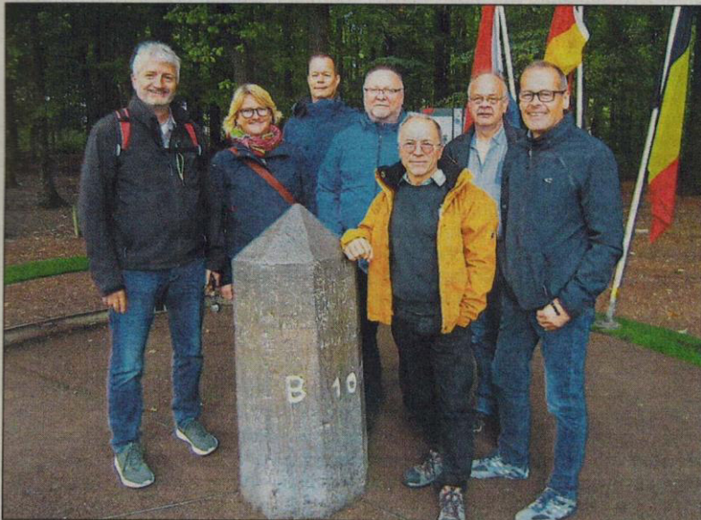
In diesem Jahr war Aachen das Ziel für das Karate-Dojo-Rüdesheim.

Nähere Informationen zu den sportlichen Aktivitäten unter www.karate-dojo-ruedesheim.de .