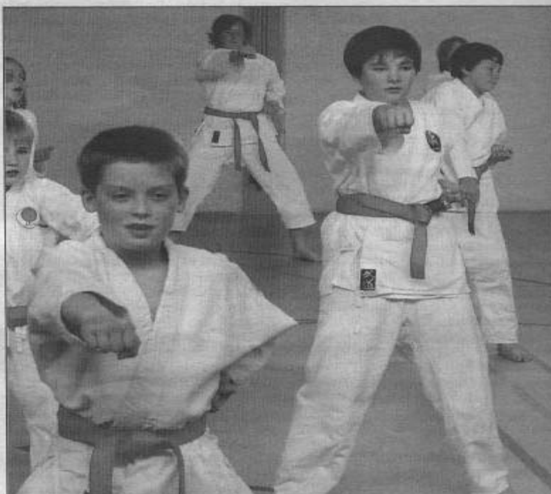
Der Nachwuchs des Karate-Dojo-Rüdeshheim e.V. beim jährlich stattfindenden Lehrgang für Kinder und Jugendliche in Niedernhausen.