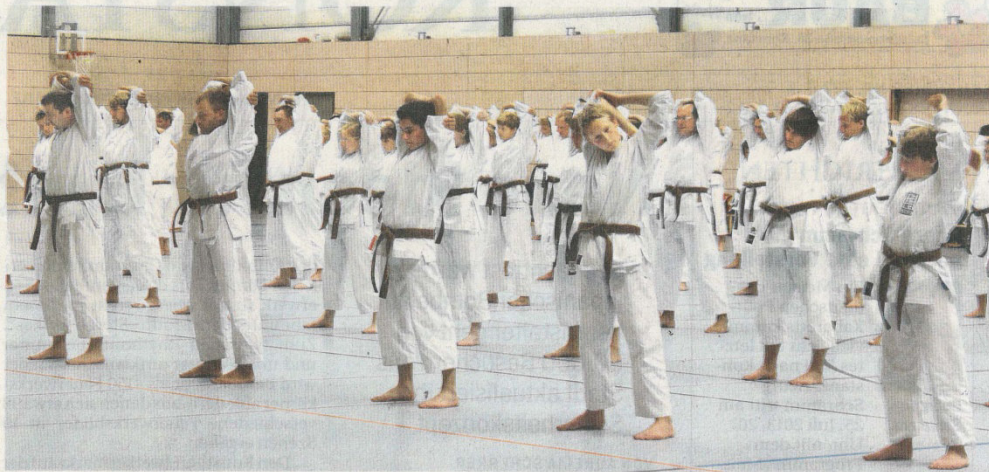
Über 100 Teilnehmer des Karate-Gasshuku beim Aufwärmen vor dem Training in der Schänzlehalle. Dreimal am Tag wird in verschiedenen Leistungsgruppen trainiert.