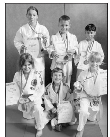
Eine erfolgreiche Bilanz für das erste Halbjahr kann der Judoclub Geisenheim verbuchen.