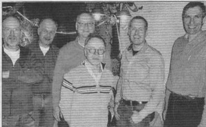
Der neue Vorstand hofft weiterhin auf eine rege Trainingsbeteiligung und freut sich über neue Gesichter.

Ein neuer Anfängerlehrgang für Erwachsene und Jugendliche ab zwölf Jahren wird nach den Sommerferien starten. Aktuelle Informationen finden man zeitnah auf der Vereinshomepage www.karate-dojo-ruedesheim.de