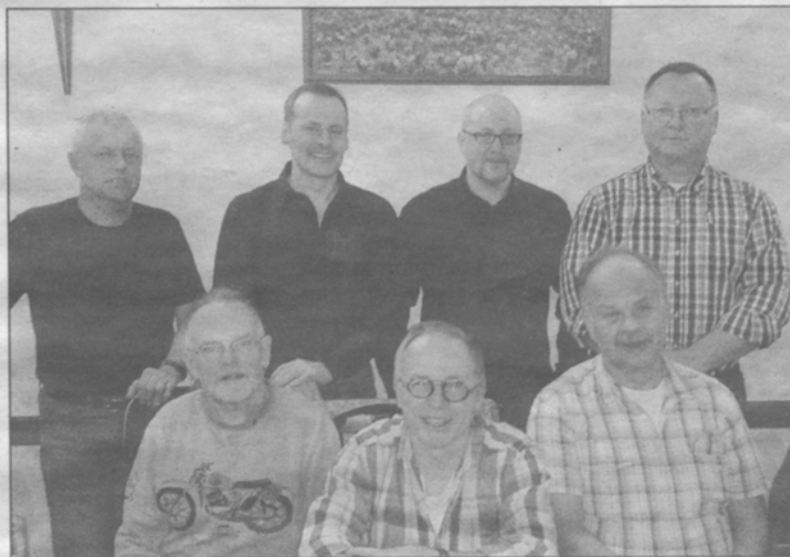
Der Vorstand des Karate Dojo Rüdesheim.

Die Jahreshauptversammlung wurde mit einem positiven Rückblick auf das Jahr 2013 geschlossen. Vorstand und Mitglieder sind sich einig, dass das vom Karate Dojo Rüdesheim gelebte Vereinsleben, nicht nur aus sportlicher Sicht, eine Bereicherung für jeden Einzelnen ist. Alle Karateka freuen sich auf eine rege Teilnahme beim Anfängerlehrgang im Mai. Weitere Infos und Filme hierzu, wie auch zum Verein, unter www.karate-dojo-ruedesheim.de , auf facebook und YouTube.