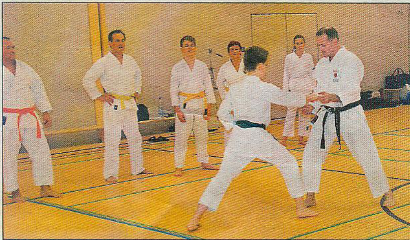
Trainiert wurde in unterschiedlichen Leistungsgruppen, je nach Gürtelfarbe.

Informationen über das Training gibt es auf der Vereins-Homepage www.karate-dojo-ruedesheim.de und auf facebook. Auf Youtube ist das Dojo inzwischen mit drei Filmbeiträgen vertreten. Das Karate-Training eignet sich für Karateka ab acht Jahren bis 99.