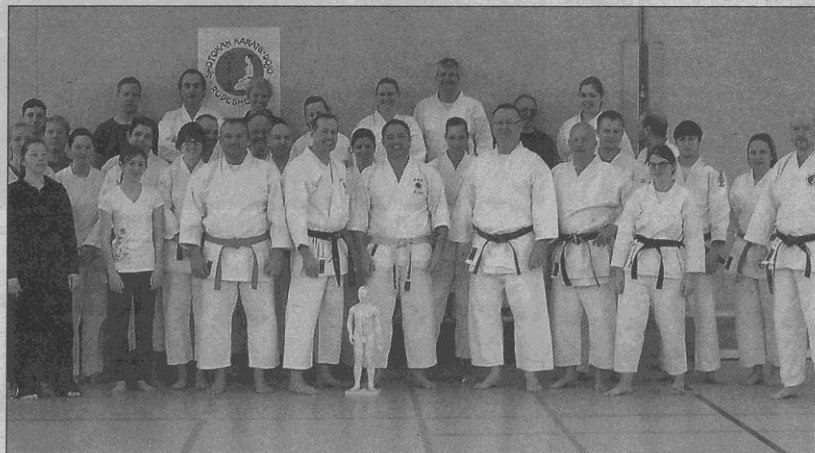
Selbstverteidigungs-Lehrgang der Karate-Dojo-Rüdesheim in der Sporthalle der Geisenheimer Grundschule.

Abschließend lässt sich sagen, dass es für alle Beteiligten ein gelungener Nachmittag war. Der Vorstand des Vereins plant eine Wiederholung bzw. Fortsetzung des Lehrgangs im nächsten Jahr. Aktuell geht es im Verein nach den Osterferien mit dem Ausbau der Kinderkarategruppe weiter. Informationen zum Kindertraining und zum Verein unter www.Karate-Dojo-Ruedesheim.de