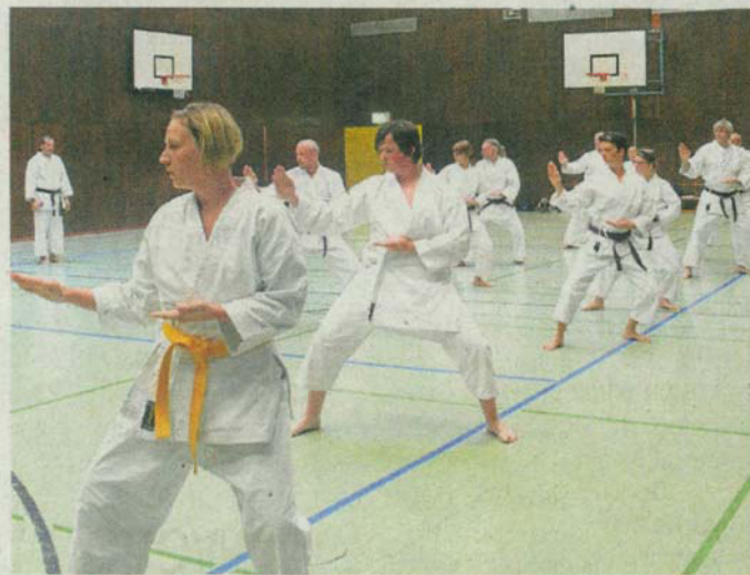
Karate ist gut für den Stressabbau und die Gesundheit.

tion, Körperhaltung, Reaktionsvermögen und Wahrnehmung. Der Einstieg beziehungsweise der Wiedereinstieg ist grundsätzlich in jedem Alter möglich. Die fünf Trainingseinheiten finden jeweils mittwochs um 18.30 Uhr in der Sporthalle des Rheingau-Gymnasiums in Geisenheim (Sporthalle am Monrepos-Park) statt. Der Einsteiger-Kurs kann natürlich auch verschenkt werden. Im Zweiradhaus Frickhofen in Rüdesheim und in der Geisenheimer Baumschule können Gutscheine erworben werden. Weitere Informationen erteilen Peter Frickhofen unter Tel. 06722 / 910668 und Hans Georg Bartsch Tel.06722 / 75622. Der Kostenbeitrag beträgt 25 Euro. Einen informativen Einblick in das Karate-Training und das Vereinsleben bieten der neue Trainingsfilm auf YouTube und die Homepage www.karate-dojo-ruedesheim.de