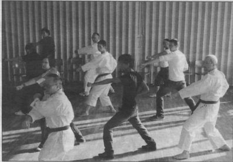
Am Ende der Stunde konnten sich die Schüler über die fließende Ausführung der ersten Kata „Taikyoku shodan“ freuen.

Die SchülerInnen lernten neben Abwehr- und Angriffstechniken auch das richtige Gehen kennen. Es stellte sich heraus, dass die Koordination gar nicht so einfach war. Aus diesen ersten Grundtechniken wurde, verbunden mit einigen Dreh- und Wendungen, dann eine Kata (Kata = imaginärer Kampf gegen zwei oder mehr Gegner) zu-