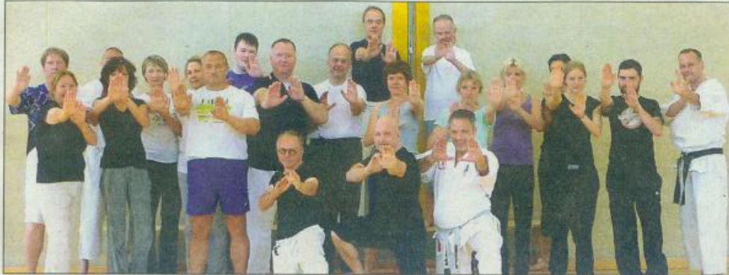
Der Rüdeshheimer Karate Verein bot einen Selbstverteidigungs-Tageskurs an.

„Dein Tag! – Selbstverteidigung – kompakt, einfach und effektiv für alle“