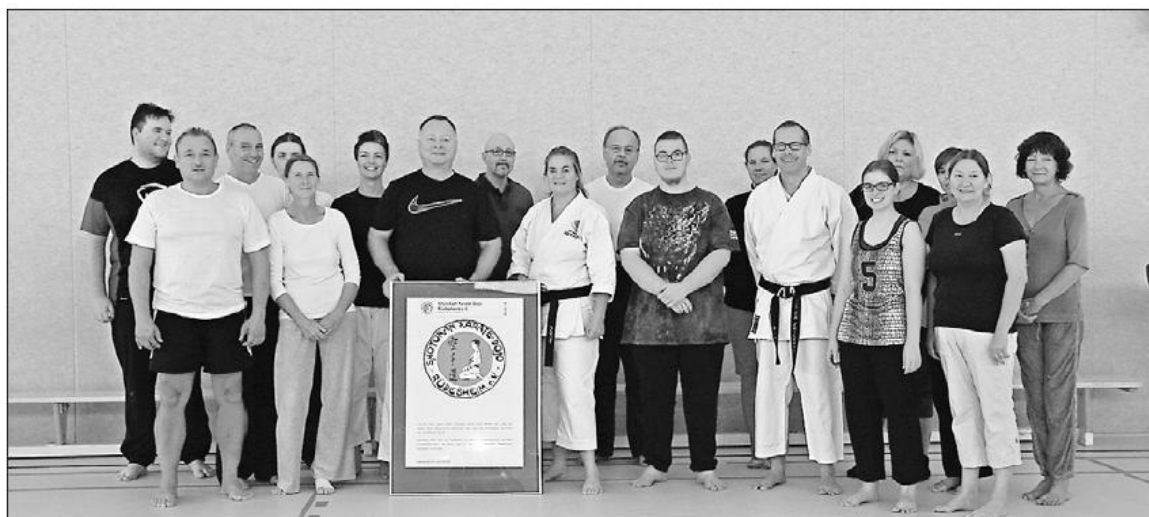
Die Teilnehmer des Karate-Lehrgangs in Geisenheim.

Übungen mussten jedoch Kontaktangst, erste Schockreaktion und mögliches Gefühl von Unterlegenheit durch selbstsicheres Auftreten überwunden werden. In den kurzen Pausen des Tageslehrgangs war zudem Gelegenheit zu anregenden Gesprächen und leckeren Erfrischungen gegeben. Bereits seit zwei Jahren etablieren die Rüdesheimer Karateka zusätzlich zu Veranstaltungen im Rahmen des Kampfsports eine Fortbildungslinie zur Selbstverteidigung und Selbstbehauptung mit wechselnden Gastreferenten.